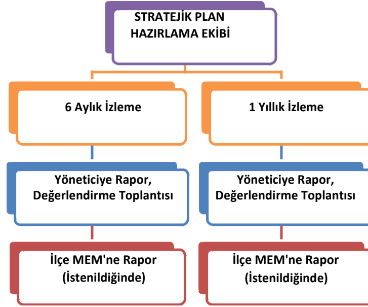
Şekil 3 İzleme ve Değerlendirme Süreci

Müdürlüğümüzün 2024-2028 Stratejik Planı İzleme ve Değerlendirme sürecini ifade eden İzleme ve Değerlendirme Modeli hazırlanmıştır. Okulumuzun Stratejik Plan İzleme-Değerlendirme çalışmaları eğitim-öğretim yılı çalışma takvimi de dikkate alınarak 6 aylık ve 1 yıllık sürelerde gerçekleştirilecektir. 6 aylık sürelerde Okul Müdürüne rapor hazırlanacak ve değerlendirme toplantısı düzenlenecektir. İzleme-değerlendirme raporu, istenildiğinde İlçe Milli Eğitim Müdürlüğüne gönderilecektir.